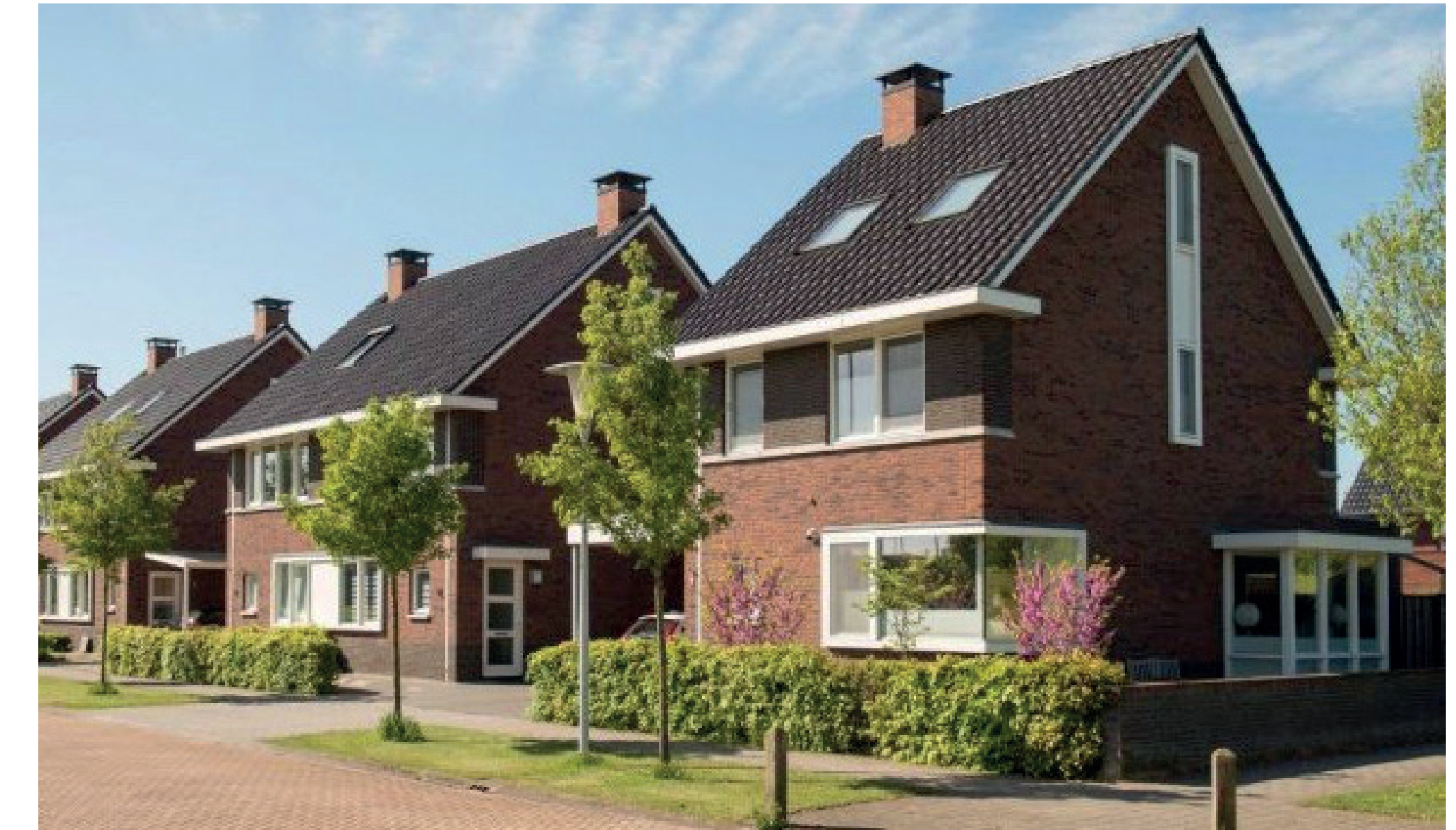
tweekappers en half-vrijstaand geschakelde woningen