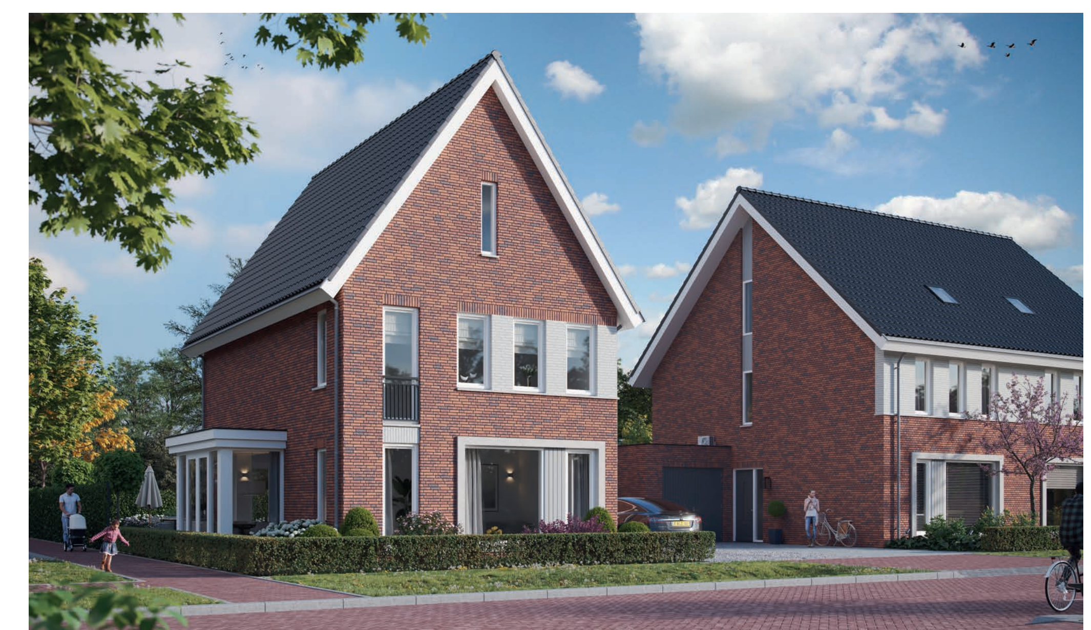
vrijstaande woningen en vrije bouwkavels