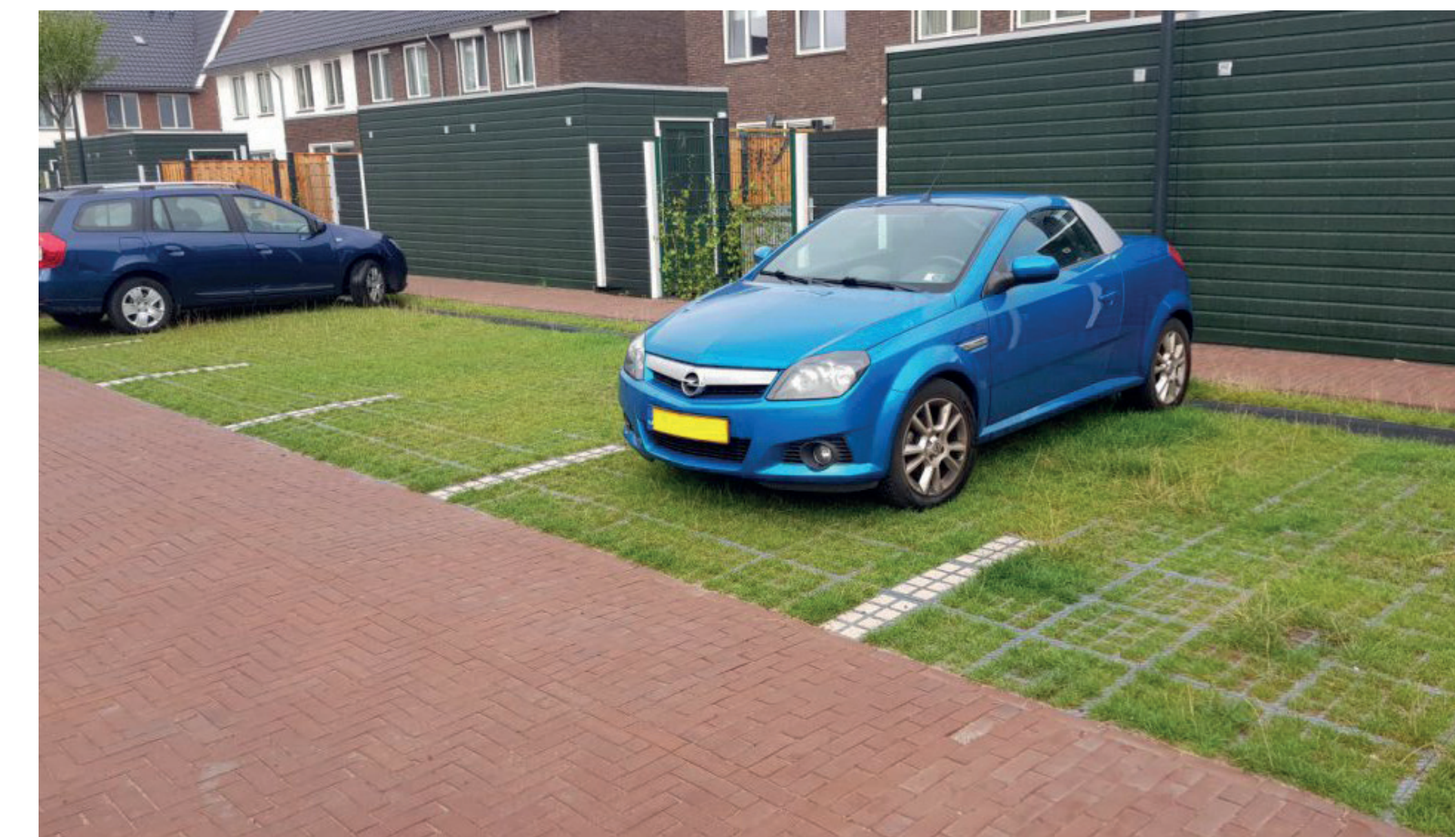
parkeerhoven achter de woningen