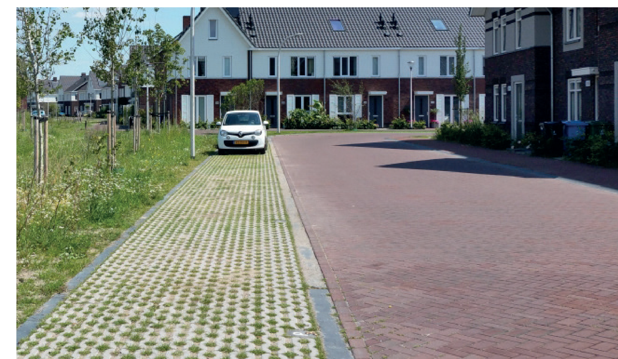
strook langsparkeren aan de weg