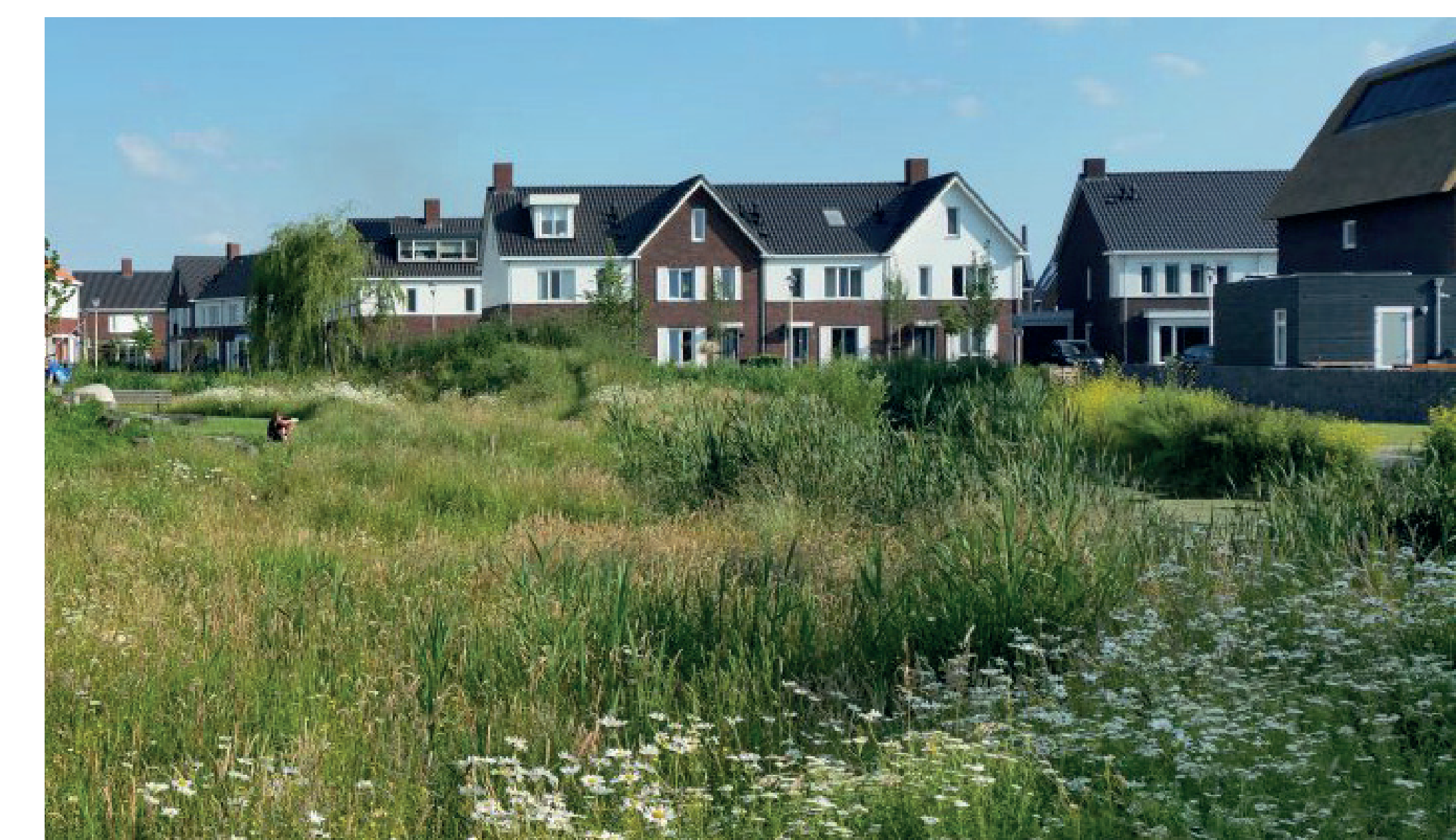
parkzone aan de rand van het plan