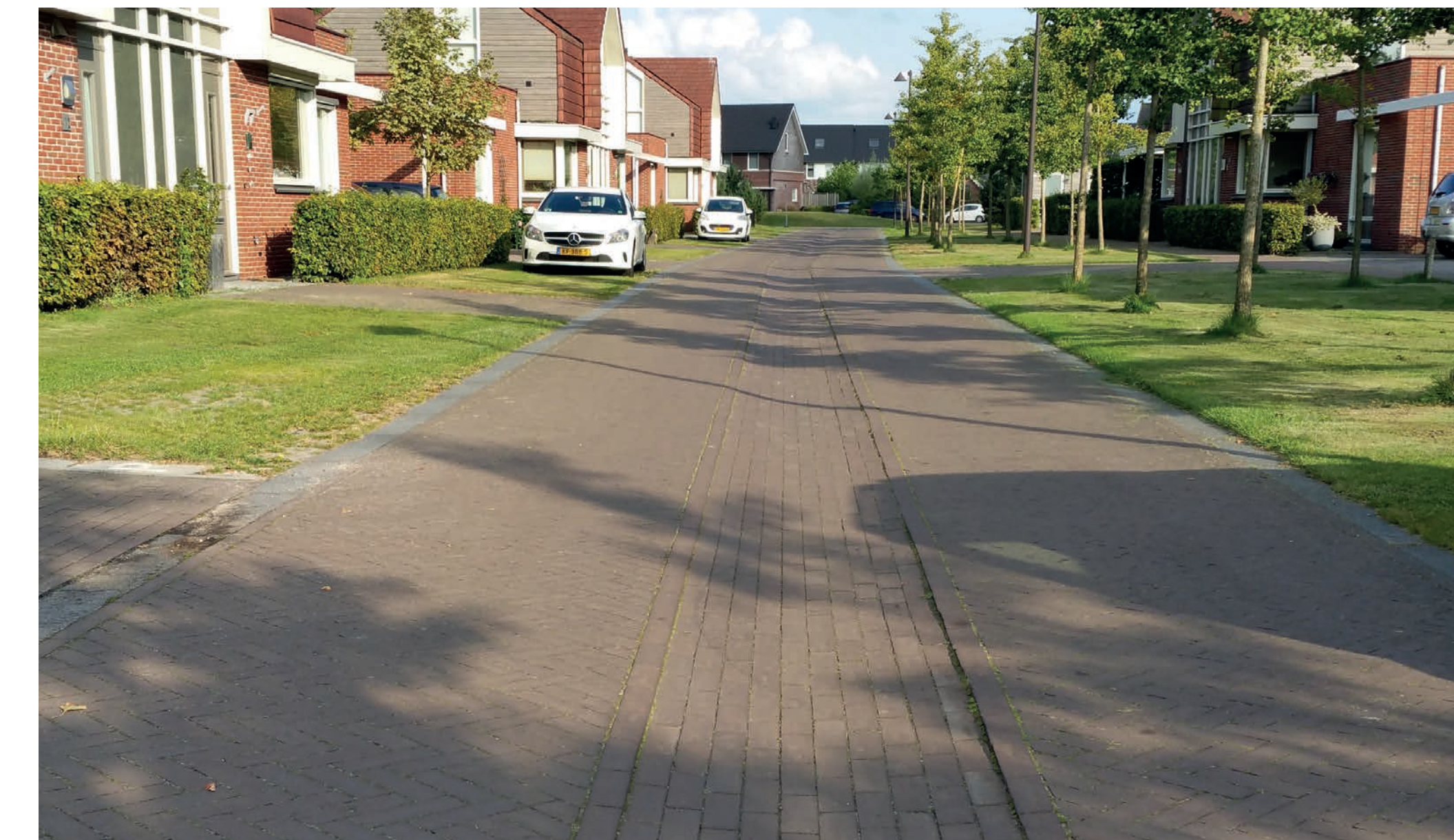
waar mogelijk klimaatadaptieve straatprofielen