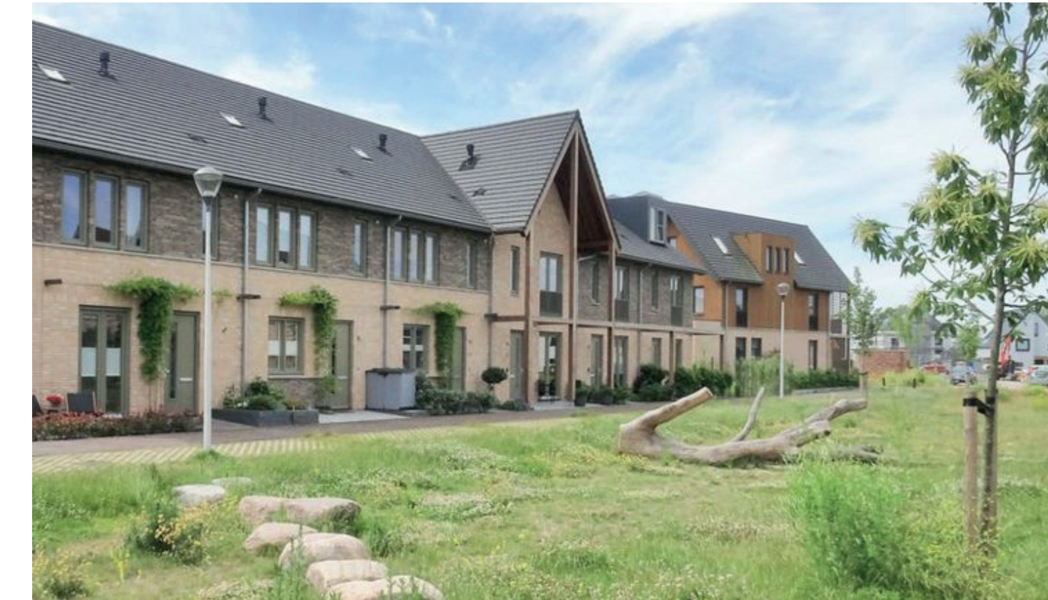
wonen aan het groen