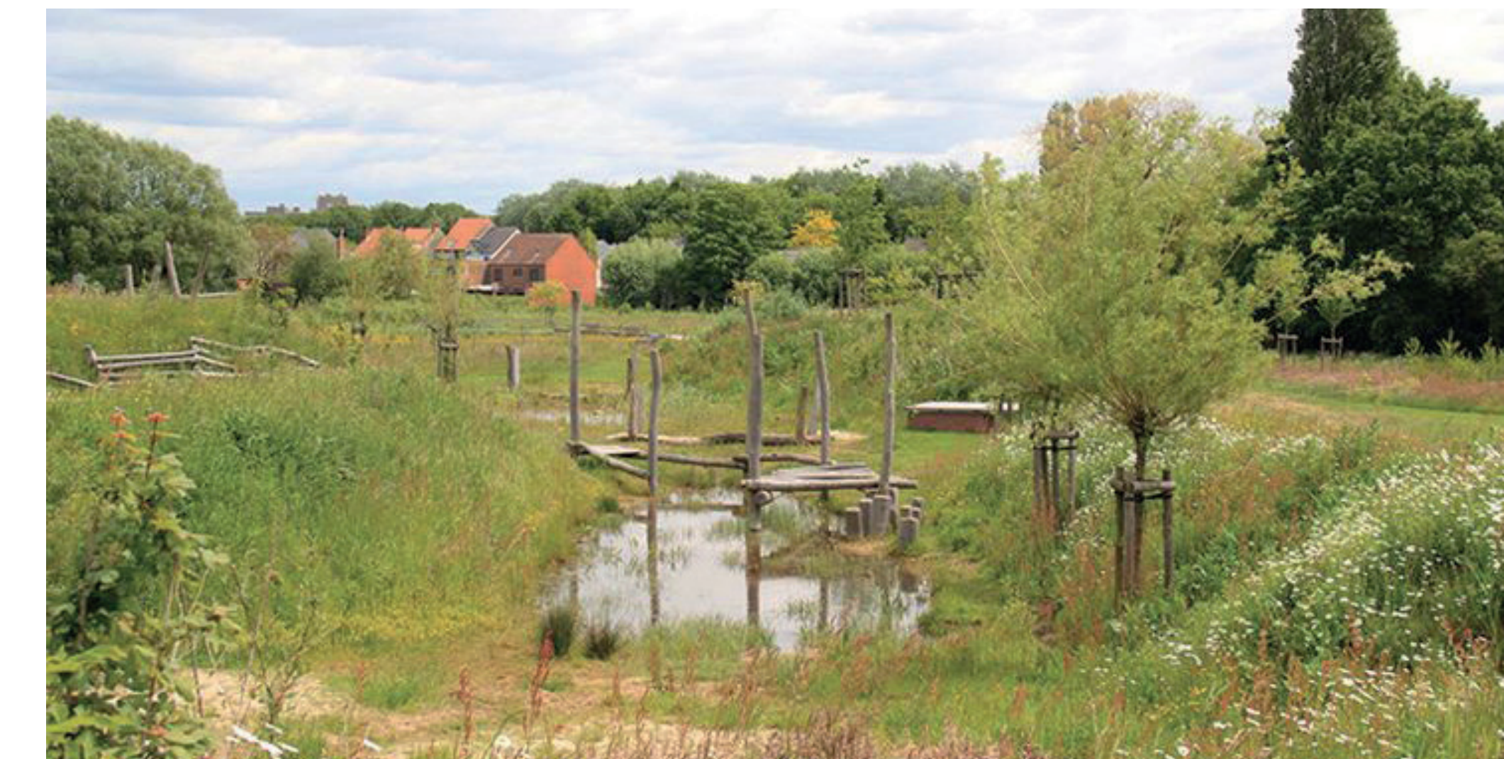
natuurlijk vormgegeven spelaanleiding